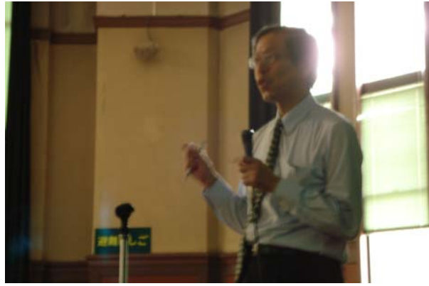
外 須美夫 九州大学医学部麻酔科学教授