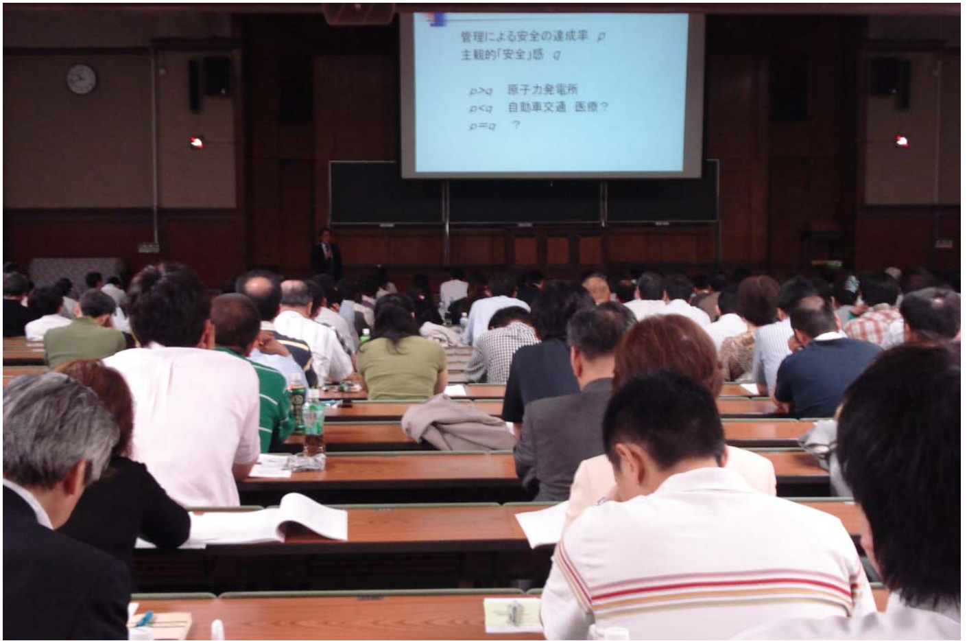
村上 陽一郎 東大特任教授 (同名誉教授)